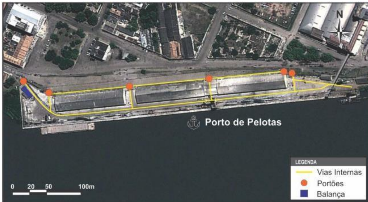
Figura 122 – Vias Internas do Porto de Pelotas